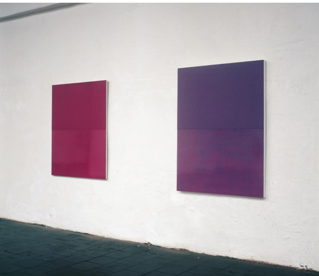
RO-H2/98, 1998; 123 x 100 cm und VIO-H2-99, 1999; 135 x 100 cm, Ölfarbe auf Holz