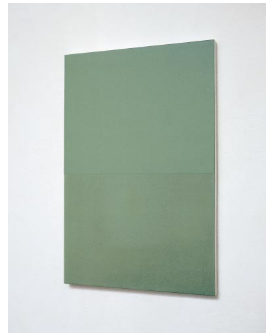
GRÜ-H7-99, 1999; 65 x 43 cm, Ölfarbe auf Tischlerplatte

Van der Grinten, Kranenburg; Haus Koekkoek, Kleve; Kulturamt, Stadt Pulheim; Karl-Ernst-Osthaus Museum, Hagen