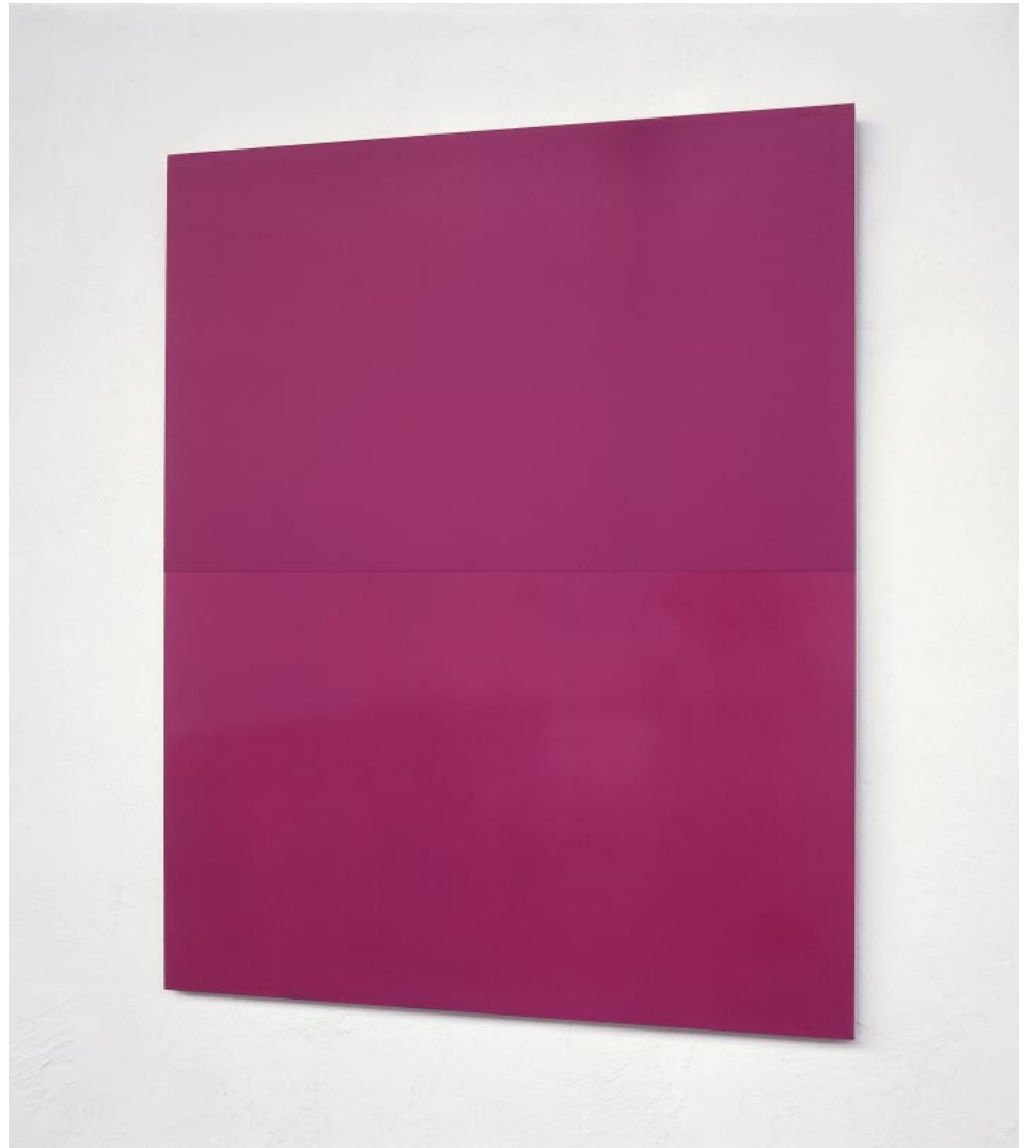
RO-H2/98, 1998; 123 x 100 cm, Ölfarbe auf Holz