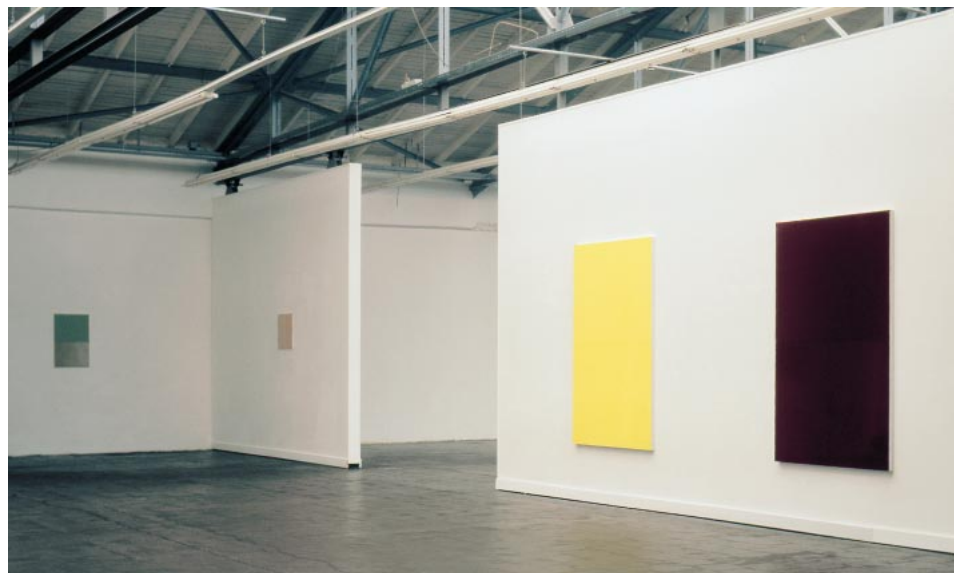
Ausstellung im Verein für aktuelle Kunst in Oberhausen