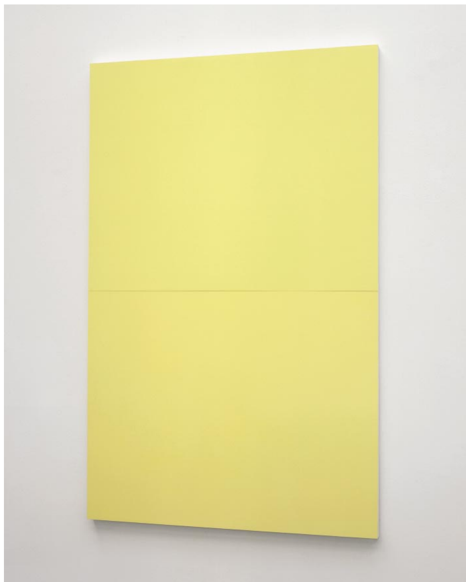
GE-H4/99, 1999; 163,3 x 103 cm, Ölfarbe auf Holz