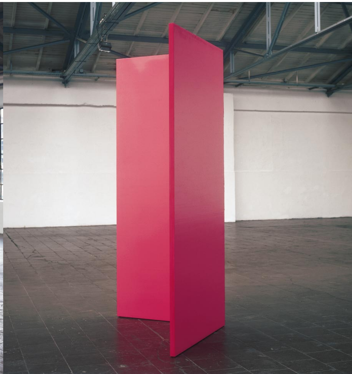
ROS-Wi5/99, 1999; 220 x 96 x 96 cm, Ölfarbe auf Holz